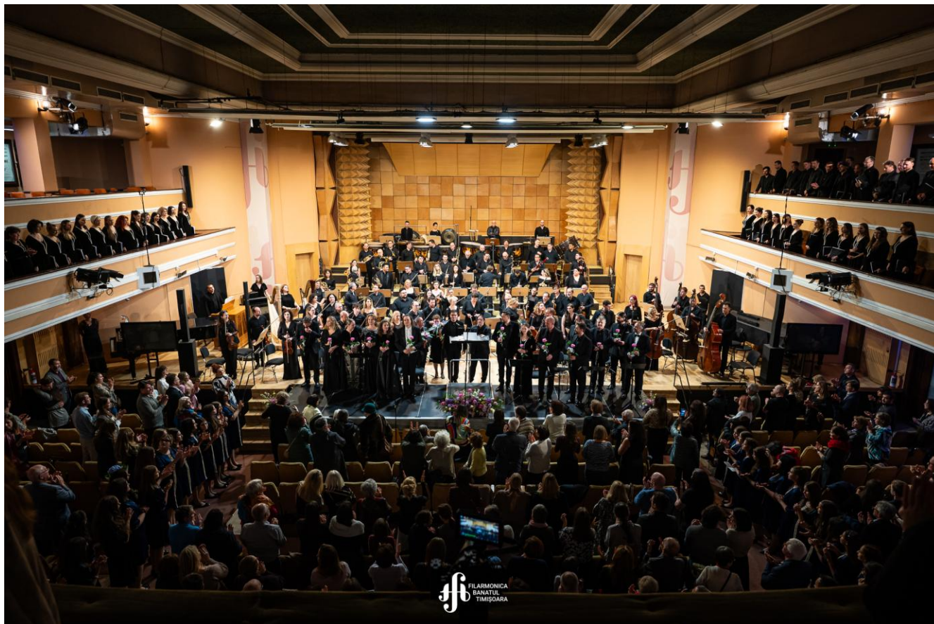
3 octombrie 2025 – G. Enescu, opera Oedip

Filarmonica „Banatul” din Timișoara este o instituție publică de cultură cu personalitate juridică, înființată prin Legea nr. 131 din 17 aprilie 1947 privind organizarea Orchestrelor Filarmonice „Banatul” din Timișoara și „Oltenia” din Craiova. Instituția funcționează cu patrimoniu propriu și își desfășoară activitatea pe baza finanțării asigurate din bugetul local – Capitolul Cultură – precum și din venituri extrabugetare provenite din activități artistice, proiecte și parteneriate culturale.